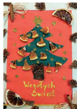
KGW Modła Królewska