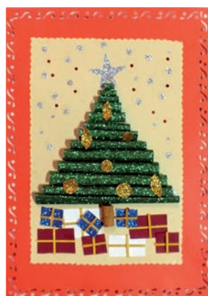
KGW Stare Miasto