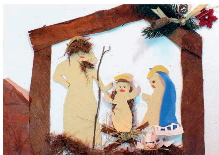
KGW Lisiec Mały