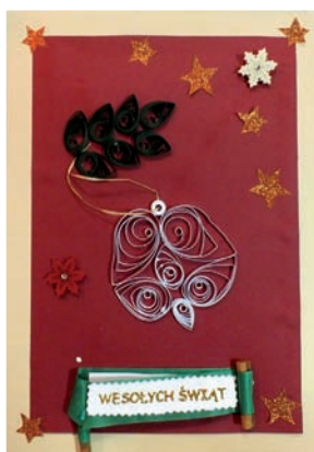
KGW Krągola Pierwsza