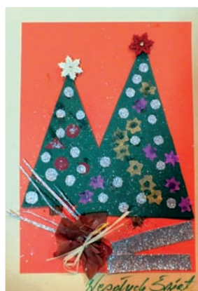
KGW Lisiec Wielki