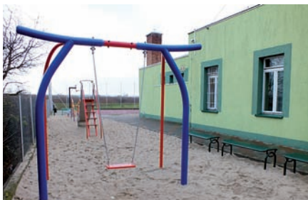
plac zabaw w Rumie

W tym roku na terenie gminy powstało łącznie aż 6 nowych placów zabaw. Jest to swego rodzaju rekord. Zławsza, że do sfinansowania ich budowy w większości pozyskiwano środki pozabudżetowe. Pierwszy plac zabaw w Liścu Wielkim został w całości zasponsorowany przez Intermarche, kolejny powstał przy Innowacyjno – Integracyjnym Ośrodku Edukacji Przedszkolnej w Starym Mieście (dzięki wsparciu CH Ferio oraz firmy VKF Spork Heinz Renzel). Kolejne 4 place zabaw zostały wybudowane dzięki pozyskaniu środków z Europejskiego Funduszu Rolnego na rzecz Rozwoju Obszarów Wiejskich. Mowa tutaj o placach zabaw powstałych w miejscowościach: Barczygłów, Krągola Pierwsza, Rumie i Żdźary. W dniu 24 października dokonano końcowego odbioru zrealizowanych inwestycji. Na placach zainstalowano m.in. takie urządzenia jak: Huśtawki wahadłowe, bujaki sprężynowe, karuzele i zjeżdżalnie. Wartość inwestycji to 264 tys. zł. W planach samorządu jest wyposażenie każdej wsi w plac zabaw.