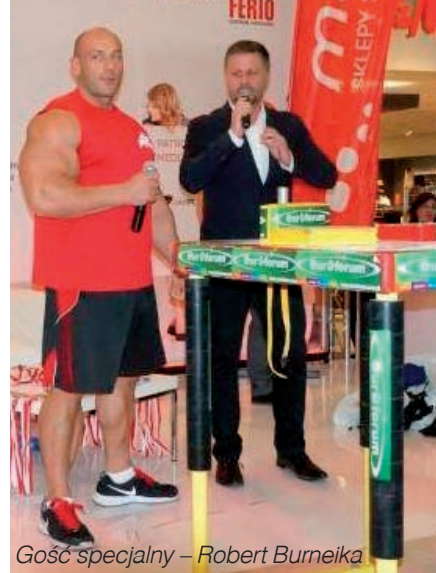
Gość specjalny – Robert Burneika

W tegorocznej edycji udział wzięło ponad 110 zawodników z ponad 50 miast Polski. Zmierzyli się oni ze sobą w kilku kategoriach. Eliminacje odbywały się na Sali gimnastycznej przy Gimnazjum w Starym Mieście, a finały w Centrum Handlowym Ferio. Tam też pojawił się gość specjalny Robert Burneika – litewski kulturysta, znany przede wszystkim z serii filmów umieszczonych na serwisie interneto-