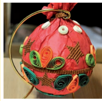
KGW Krągola Pierwsza