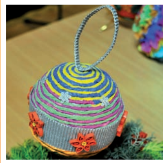
KGW Lisiec Wielki