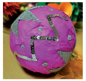
KGW Modła Królewska