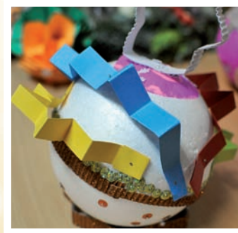
Uczniowie SP Barczygłów