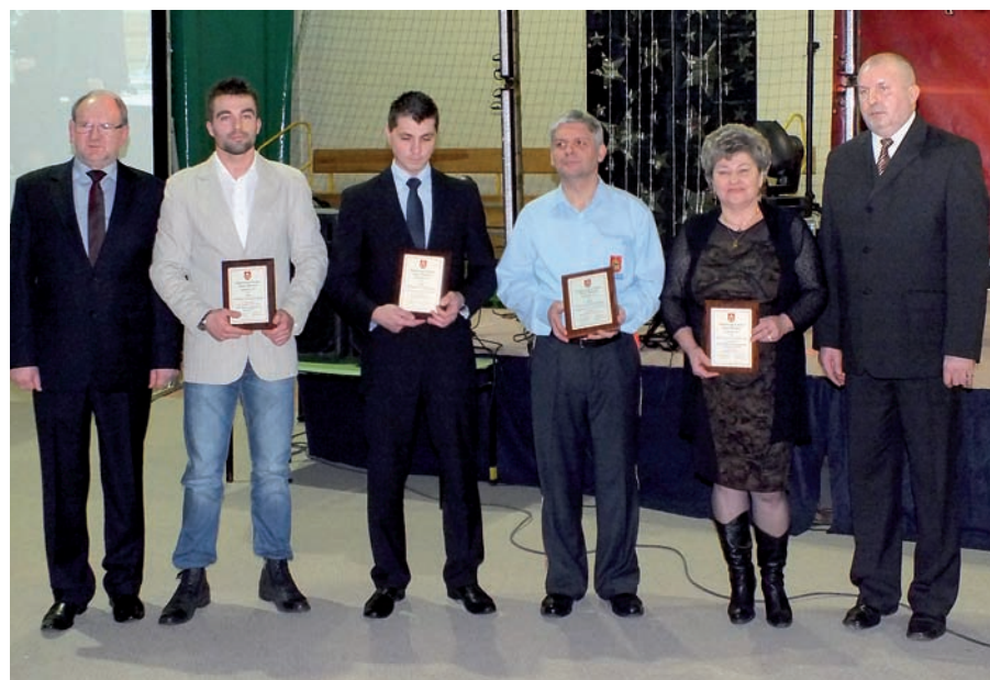
Nominowani w kategorii „Człowiek Roku”