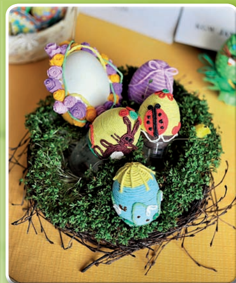
III miejsce KGW Krągola Pierwsza