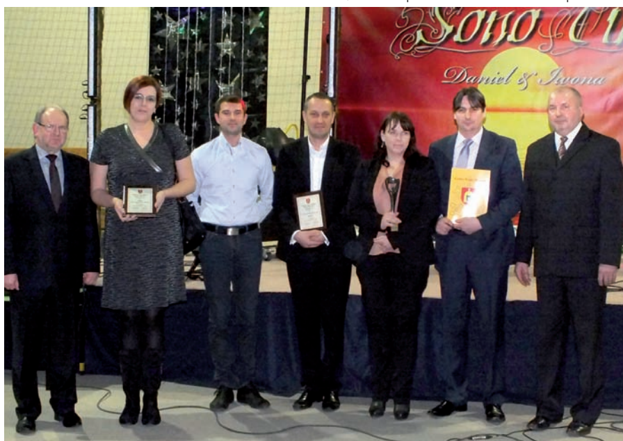
Laureaci w kategorii „Sponsor Roku”

W dalszej części imprezy Wójt Gminy w swoim przemówieniu podsumował