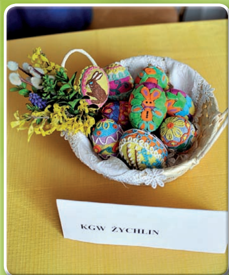
I miejsce KGW Żychlin