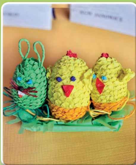
II miejsce KGW Janowice