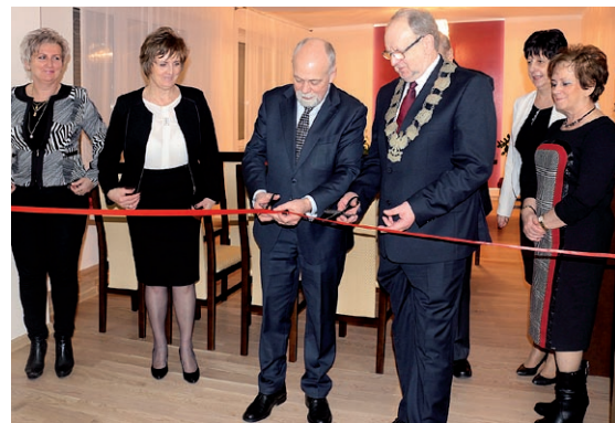
Otwarcie sali z udziałem Wojewody Wielkopolskiego Piotra Florka

„Postanowiliśmy przebudować pomieszczenia Urzędu Gminy na potrzeby nowej sali ślubów Urzędu Stanu Cywilnego. Chcemy, aby pary małżeńskie oraz ich goście byli przyjmowani w eleganckich warunkach. Warto podkreślić, że przebudowę zrealizowaliśmy w całości wyłącznie dzięki otrzymanym środkom zewnętrznym. Zadania Urzędu Stanu Cywilnego są zadaniami zleconymi gminie z zakresu administracji rządowej. Dlatego wystąpiliśmy o sfinansowanie remontu do Wojewo-