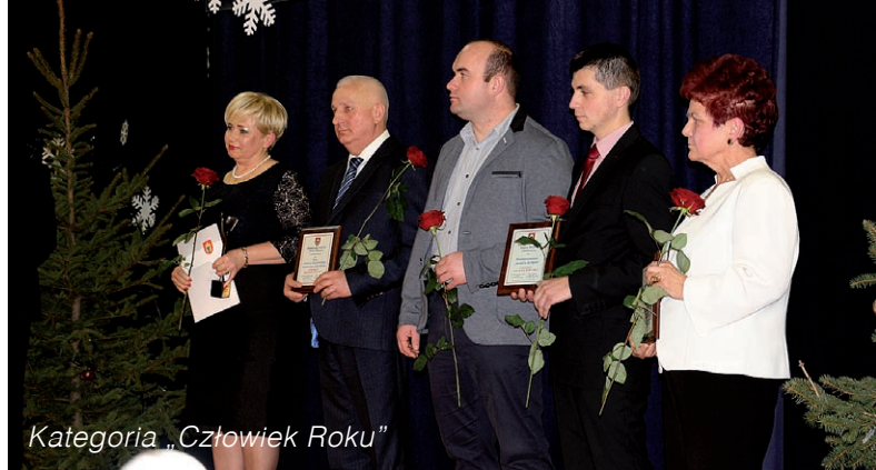
Kategoria „Człowiek Roku”