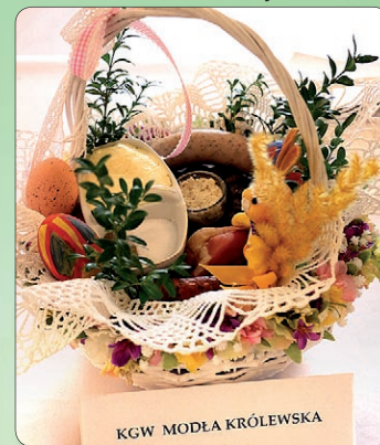
KGW MODŁA KRÓLEWSKA