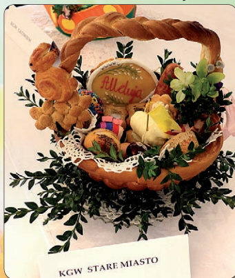
KGW STARE MIASTO