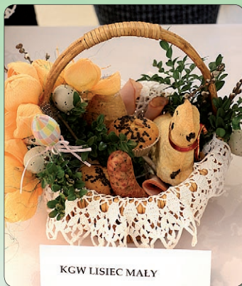
KGW LISIEC MAŁY