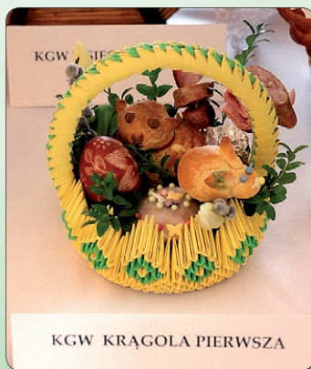
KGW KRĄGOLA PIERWSZA