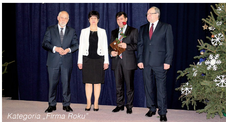
Kategoria „Firma Roku”