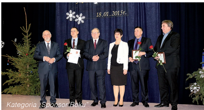
Kategoria „Sponsor Roku”