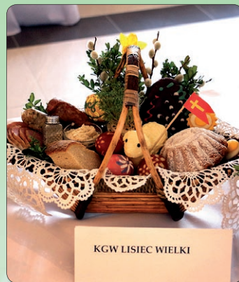
KGW LISIEC WIELKI