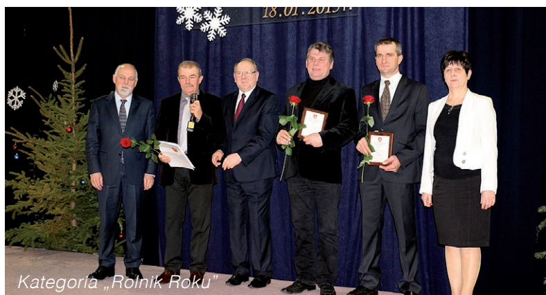
Kategoria „Rolnik Roku”