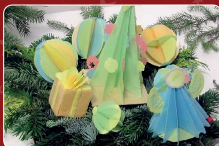
KGW Lisiec Mały