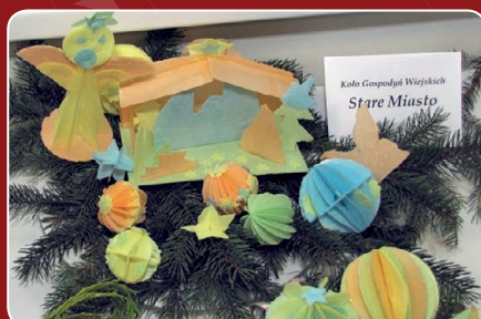
KGW Stare Miasto