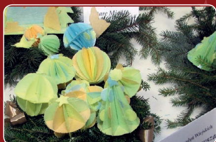
KGW Krągola Pierwsza