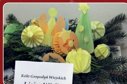
KGW Lisiec Wielki